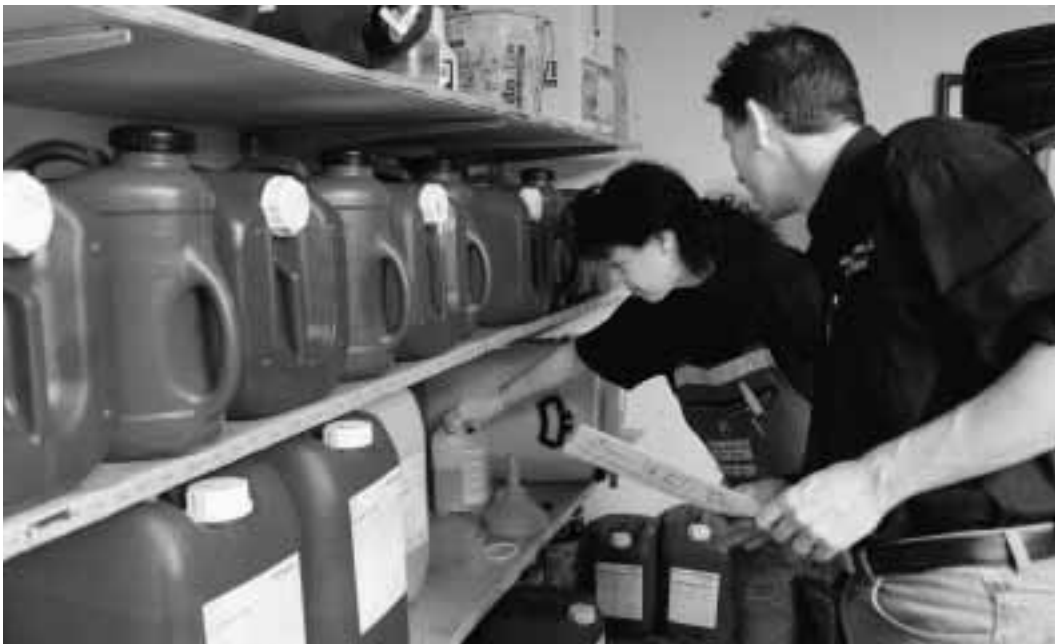
Figura 2 Magazzino per sostanze pericolose. Bisogna tener conto dei pericoli derivanti dall'uso di sostanze pericolose.