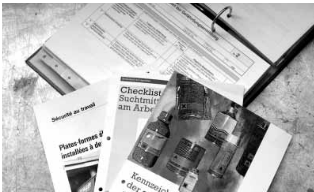
Figura 4 Questi supporti possono semplificarvi il lavoro.

All'indirizzo Internet www.suva.ch/waswo-i è possibile trovare tutti i supporti informativi della Suva, nonché numerose altre pubblicazioni. I supporti informativi della Suva e della CFSL possono essere ordinati direttamente (cestino) e spesso anche scaricati da Internet.