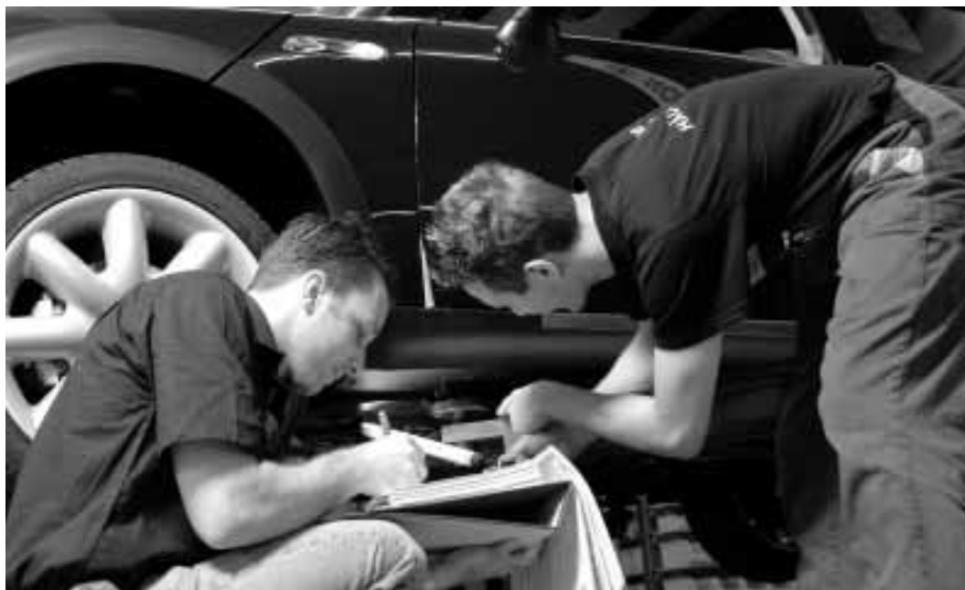
Figura 3 Individuazione dei pericoli sul posto di lavoro.

Non dimenticate i pericoli associati alle attività di pulizia, eliminazione guasti e manutenzione.