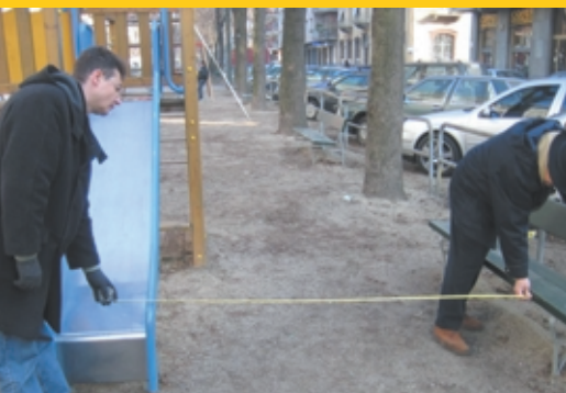
In questa pagina, foto di tecnici che verificano caratteristiche e collocazione delle attrezzature.

Le modalità specifiche per la manutenzione e il controllo delle aree sono indicate nella norma tecnica EN 1176-7 "Attrezzature per aree da gioco - Guida all'installazione, ispezione, manutenzione e utilizzo".