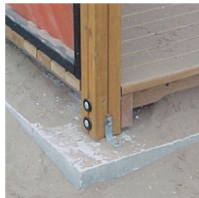
Pericolo connesso a cemento esposto.