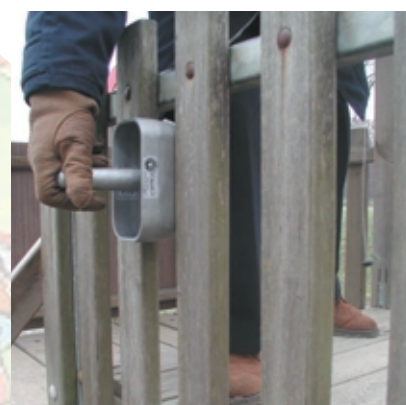
Verifica degli spazi di intrappolamento della testa.