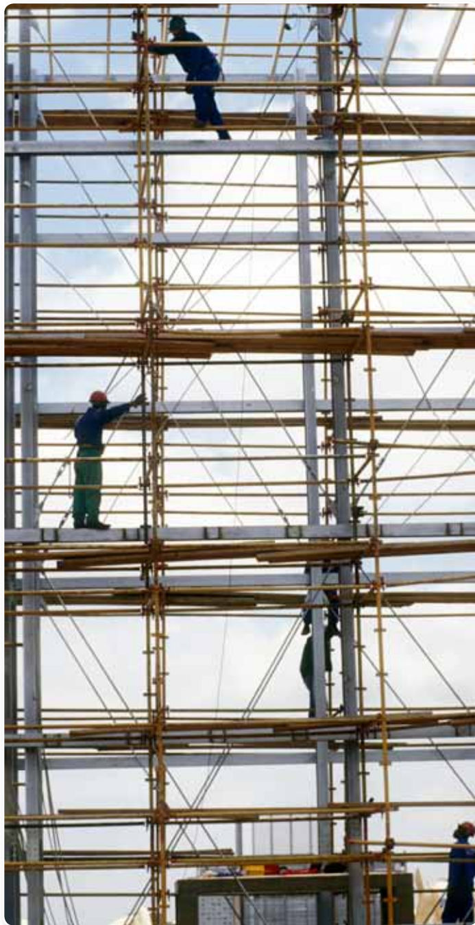
Graeme Williams, Operai a lavoro per costruire il palazzo della nuova Corte Costituzionale, Johannesburg, 2003, 2003, Africanpictures.net/Archivi Alinari, Firenze

La constatazione che, nonostante la peculiare attenzione dal punto di vista normativo, gli indici infortunistici propri delle lavorazioni in appalto (si pensi, per tutte, ai lavori di manutenzione o di pulizia da parte di imprese "esterne") rimanevano superiori a quelli di lavorazioni "interne"