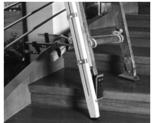
Figura 2: Il piede della scala a pioli è assicurato con fune contro il pericolo di scivolamento e può essere adattato ai gradini della scala grazie ai montanti regolabili in altezza.