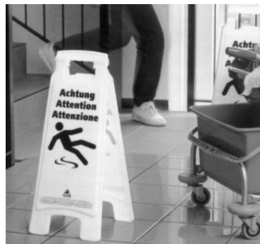
Figura 5: Segnalazione di pavimenti sdrucchiolevoli. Il cartello di pericolo è ottenibile presso la Suva (codice 6228).