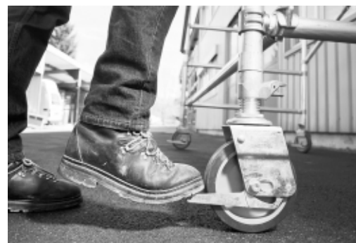
Figura 4: Prima di salire sul ponte occorre bloccarne le ruote.