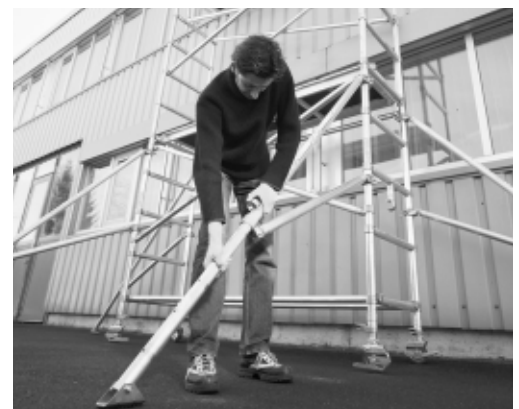
Figura 3: Come assicurare il ponte mobile su ruote contro ribaltamenti.