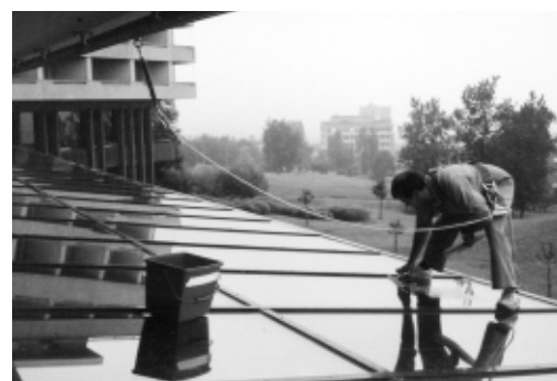
Figura 7: Protezione anticaduta con imbracatura per il corpo, fune di sicurezza e assorbitore di energia (ammortizzatore di caduta).

Per ulteriori informazioni consultare: la pubblicazione «Installazioni per la pulizia e la manutenzione di finestre e facciate» (codice Suva 44033.i).