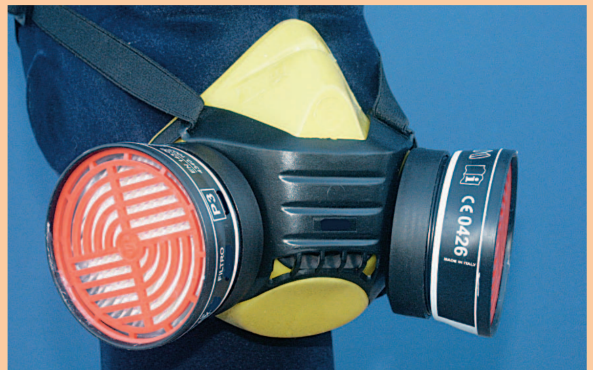
SEMIMASCHERA CON FILTRI